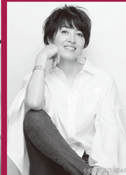
【スペシャルゲスト】 荻野目洋子

初の置賜エリアでの公演開催決定！今回のスペシャルゲストは、荻野目洋子さん！クラシックからタンゴ、ジャズ、ミュージカル、ポップスに至るまで、ジャンルにとらわれないプログラムと一流の演奏家たちの素晴らしい演奏、そしてヴァイオリニスト高嶋ちさ子さんと、フジテレビ軽部アナウンサーの絶妙なコンビネーションが生まれる愉快きわまりない軽妙なトークをぜひご覧ください！