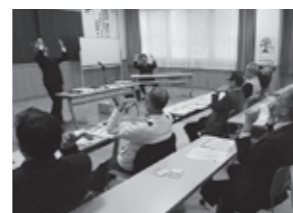
▲昨年の研修会の様子。