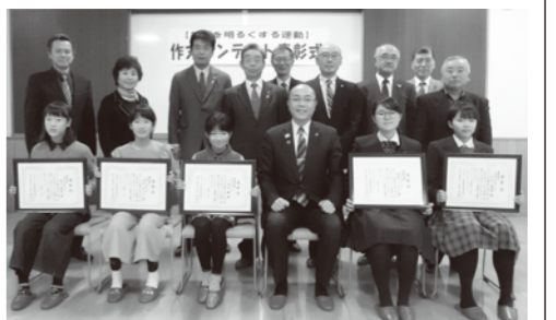
▲表彰式終了後、関係者らと記念撮影をしました。