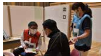
▲3/28(日)にシェルターなんようホールで行われた集団接種シミュレーションでの問診

そのため、ワクチンを接種してよいか事前に必ず相談しておきましょう。相談せずに集団接種会場に来ると、当日に接種が受けられなかったり、待ち時間が長くなったりする恐れがありますので、ご協力をお願いします。