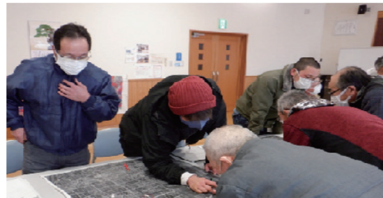
△沖郷地区の話し合いの様子

農業の担い手や経営体、認定農業者、新規就農者、農業法人、農地所有者等、地域の幅広い関係者の方のご意見を伺いながら目標地図の作成に向けた調整を行います。