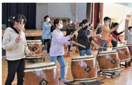
▲「きらきら・EKUBO キッズ事業」への協力