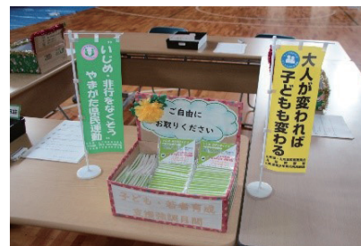
▲青少年健全育成啓発活動