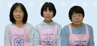
吉野地区食改の皆さん

食べきれなかったカツオの刺身がひと味違う美味しさになります。ごまは若返りのビタミンEがたっぷりです。