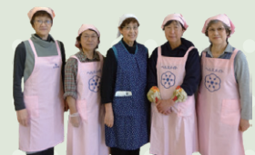
沖郷地区食改の皆さん