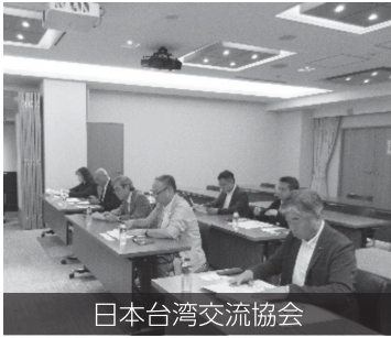
日本台湾交流協会