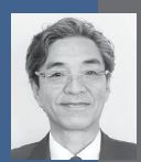
高橋 一郎 議員