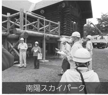
南陽スカイパーク

初めに、南陽スカイパークエリアログハウス雪害修繕工事を視察した。東側ウッドデッキが、屋根からの落雪により破損したものを、保険を適用し修繕する。現状復帰が原則との説明を受けた。