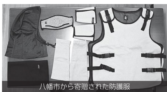
八幡市から寄贈された防護服

併せて、クマとの偶発的な遭遇を避けるため、山林などのクマの生息圏では、クマの出没情報を共有し、入山時には熊鈴などで音を出すなどの実践を。