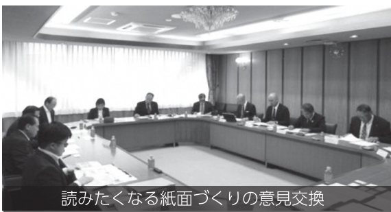
読みたくなる紙面づくりの意見交換