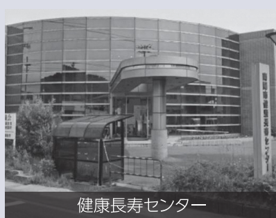
健康長寿センター

●南陽市健康長寿センター・デイサービスセンターの指定管理者を、これまでに引き続き社会福祉法人 南陽市社会福祉協議会とするもので、指定期間は令和8年4月1日から令和11年3月31日までの3年間とするもの。 以上、審査の結果全員異議なく可決した。