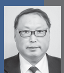
小松 武美 議員