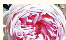
ビエールド・ロンサール