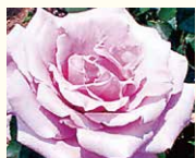
シャルルドゴール