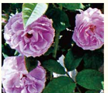
ブルボンクイーン