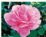
クイーンエリザベス