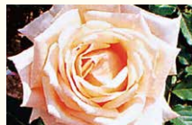
ダイヤモンドジュビリー