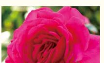
ベルサイユのバラ シリーズ