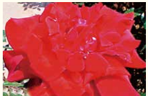
シモンポリパール