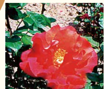
プリンセスミチコ

米沢盆地を一望できる高台の公園、双松公園にあり、広さは8,000㎡、340種類、6,000本の段丘のバラ公園。昭和42年に、南陽ロータリークラブ置賜バラ会の協力によって造られました。地形上、バラの季節には、香りが立ちのぼり、“香りのバラ公園”として親しまれており、オールドローズ系統などの珍しい品種が数多くあるバラ園です。このバラ公園のある双松公園は、毎年5月には“つつじ”が全山を彩ります。ぜひお立ち寄り下さい。