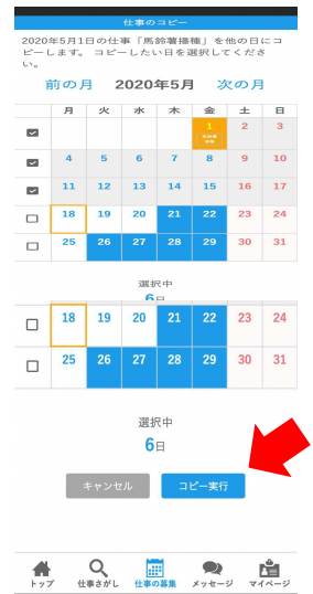
コピーで複数の日の募集