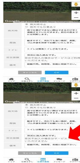
入力完了後「OK」を押す